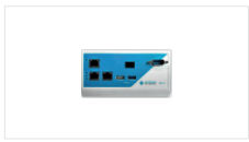
원격 데이터 수집 장비 - 50 Mbps 최대 처리량 - 가디언 기기 필요