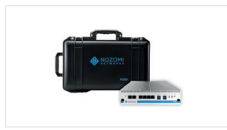
휴대용 기기 - 2,500개 노드 - 200 Mbps 최대 처리량