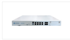
중소형 규모 - 최대 40,000개 노드 - 250 Mbps-1 Gbps 최대 처리량