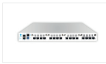
엔터프라이즈급 규모 - 최대 500,000개 노드 - 3~6 Gbps 최대 처리량