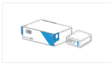
내구성 환경 - 500~5,000개 노드 - 100~800 Mbps 최대 처리량