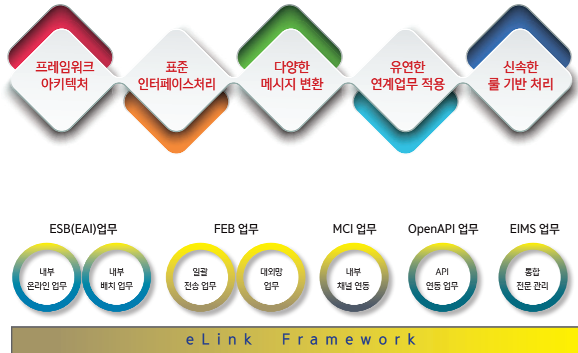
eLink 프레임워크 구조

이링크(eLink)는 기업내부의 채널과 업무시스템 연동, 대내외 시스템 연동, 기업의 오픈 API 서비스 연동 등 다양한 인터페이스 업무를 단일 플랫폼 기반의 솔루션으로 제공하며, 제1금융권 뿐만 아니라 제2금융권, 인터넷뱅크, 공공기관 등 다양한 기관에서 안정적으로 운영 되고 있습니다. 최근 6년내 금융권 EAI 부문 연계솔루션 최다 구축으로, 이엑티브만의 독자적인 기술과 연계분야에서의 노하우를 갖추어 기업 고객들에게 최고의 솔루션을 제공합니다.