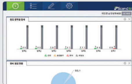
▶ 관리자 페이지 대시보드