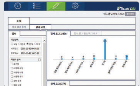
▶ 관리자 페이지 감사로그