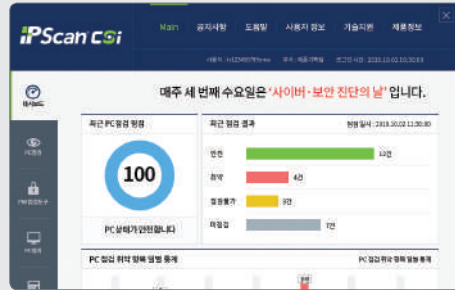
▶ 에이전트 대시보드